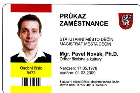
Vzor přední strany průkazu zaměstnance