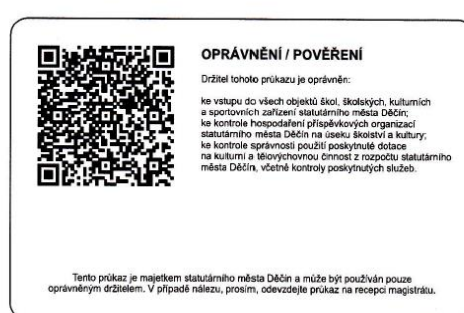
Vzor zadní strany průkazu zaměstnance