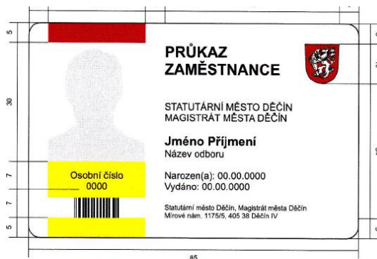
Proporční schéma přední strany průkazu zaměstnance (hodnoty jsou uváděné v mm)